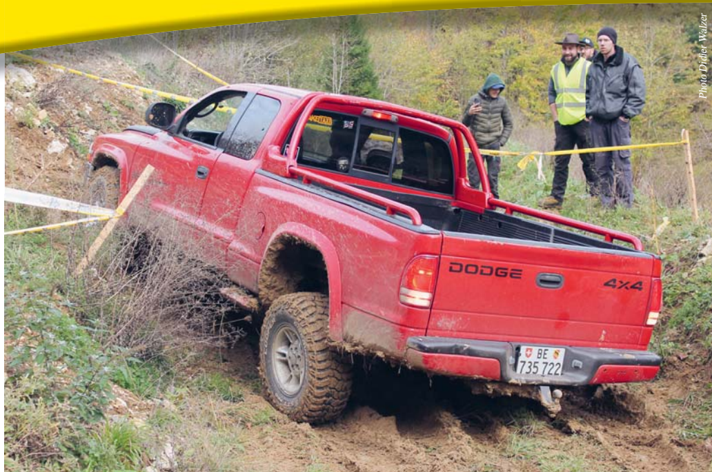
Le changement de formule n'a rien enlevé au côté très spectaculaire de l'Aventure 4x4. La preuve!

Délai de reddition des textes à paraître dans l'encart 1/2023: 21 janvier