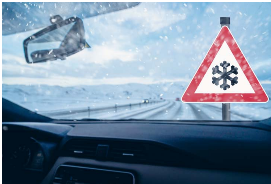
La conduite sur (neige et) glace nécessite une approche particulière.

Gardez la tête froide en toutes circonstances avec le TCS!